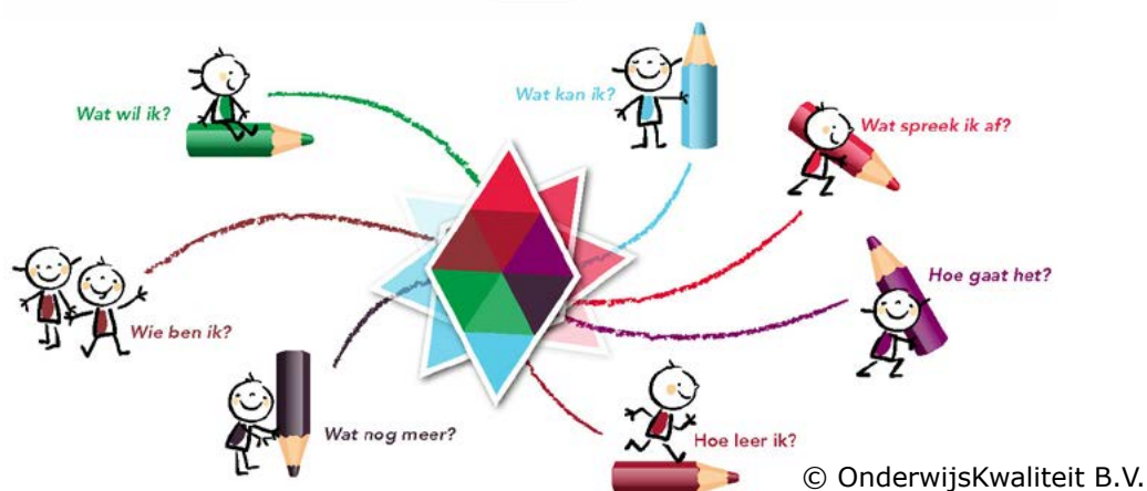
Afbeelding 4: Basisindeling Kindportfolio.online (ontwikkeling OnderwijsKwaliteit; design Maek; ICT Phact en Serve4u)

over de vragen die zij aan kinderen willen stellen en een inhoudelijke indeling van domeinen en aspecten te bepalen. Ook voor Kindportfolio.online geldt: authentiek, eigenzinnig en koersvast! Een school/IKC kan ook kiezen om te starten met een bestaande indeling, zoals in onderstaande afbeelding zichtbaar is. Om later een keuze te maken om meer eigenheid in beeld te brengen.