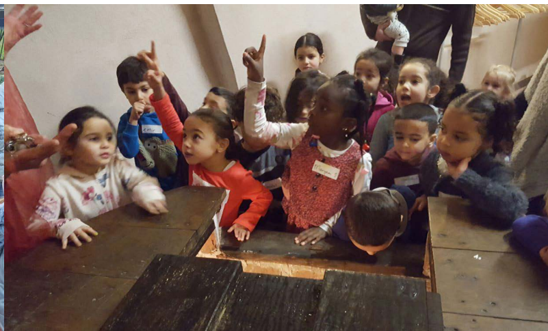
Afbeelding 3: Betekenisvolle onderwijssituaties in het onderwijsportfolio op Daltonacademie De Meiboom, Nijmegen

Wat gaat goed? Wat kan beter? Wat moet beter? Met deze basisvragen werd de proefperiode gestart. Op het oog simpele vragen, maar vaak moeilijker te beantwoorden dan gedacht. Het antwoord werd gezocht met het maken van beredeneerde keuzes en de vraag 'Wat maken we zichtbaar in ons onderwijsportfolio?'. De