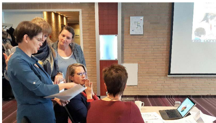
Afbeelding 4: Directeuren inspireren elkaar om inhoud te geven aan een zinvolle verantwoording.

met de werkwijze en lieten elkaar zichtbare resultaten zien. Dit leverde zinvolle adviezen op om de begeleiding en de aanpak te verrijken.