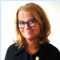
Drs. Edith van Montfort College van Bestuur, SAAM*